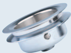
Klíňová řemenice (ocel)

EMCO VERTICAL VT 250 MY – stroj s poháněnými nástroji, osou Y a pohonem dutého vřetena