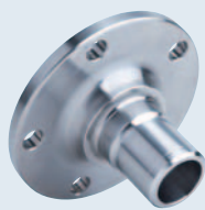
Náboj kola (ocel)